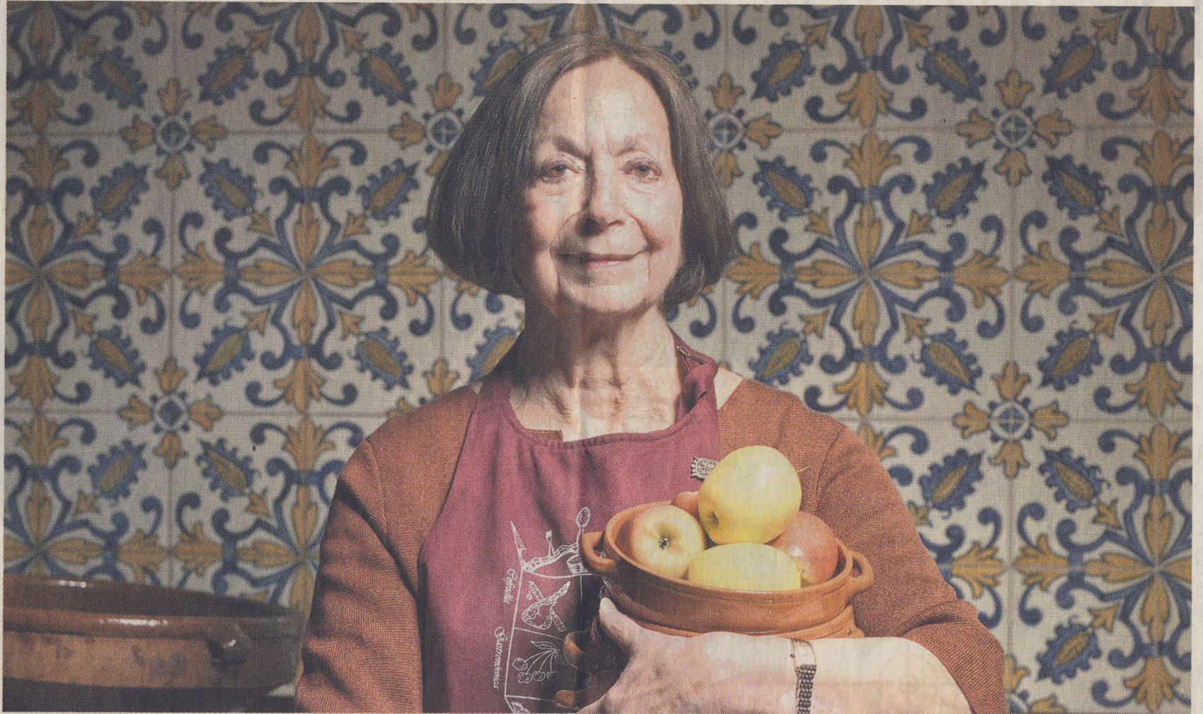
Claudia Roden in ihrer kleinen Londoner Küche. Die Rezepte für knapp 20 Kochbücher hat sie hier ausprobiert.